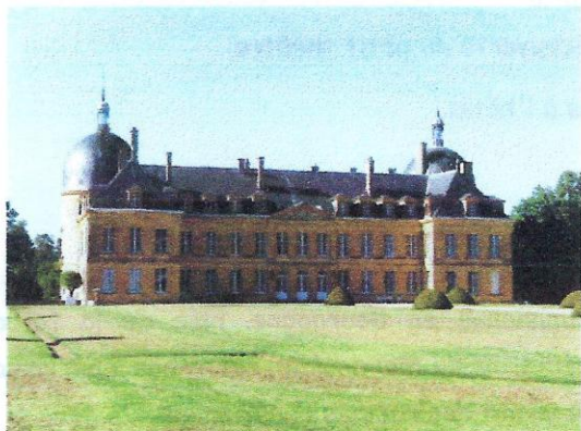
Château de Digoine